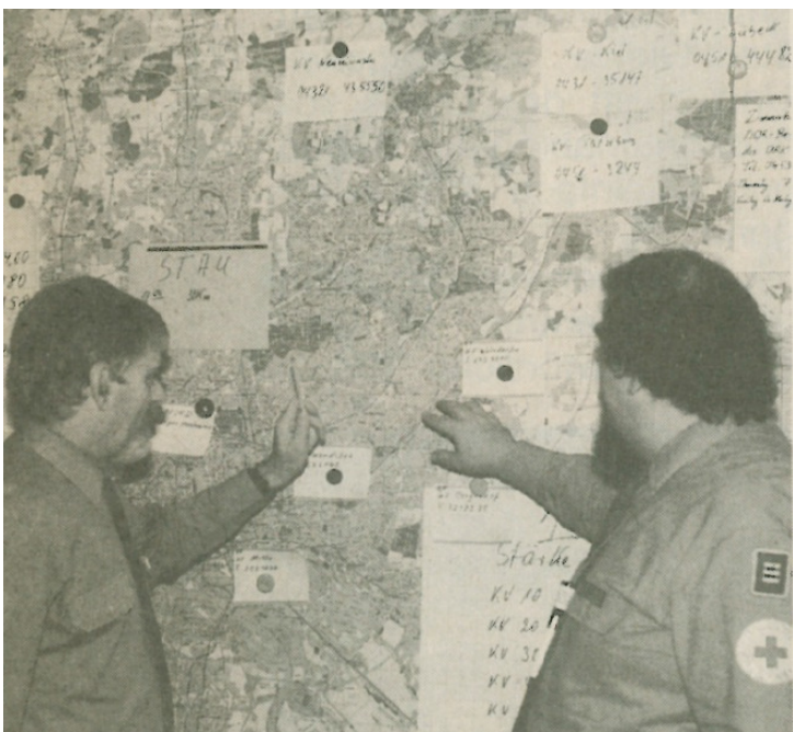
Stabsbesprechung des DRK Landesverbandes Hamburg e.V.

Das Hamburger Rote Kreuz fungierte gewissermaßen als Lotse für die einströmenden Gäste. Ein erstes Willkommen wurde den Anreisenden an