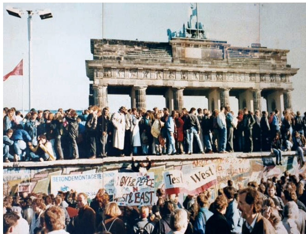
Der Mauerfall 1989 in Berlin

In den 70er und Anfang der 80er Jahre des letzten Jahrhunderts war die DDR der treueste Vasall der Sowjetunion im Warschauer Pakt, dem östlichen Militärbündnis, und bildete ein verlässliches Bollwerk an dessen Westgrenze. Seit Niederschlagung des Volksaufstands in der DDR durch Truppen der Sowjetunion am 17. Juni 1953 hatte es aus der Bevölkerung keinen breiten nennenswerten Widerstand mehr gegeben.