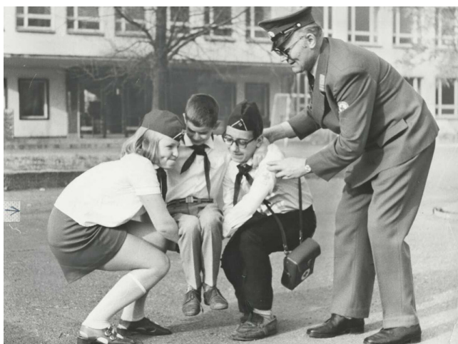
Junge Pioniere als „Junge Sanitäter“ in der DDR

Jugendrotkreuz, Wasserrettungs- und Bergunfalldienst waren Teil der Organisation.