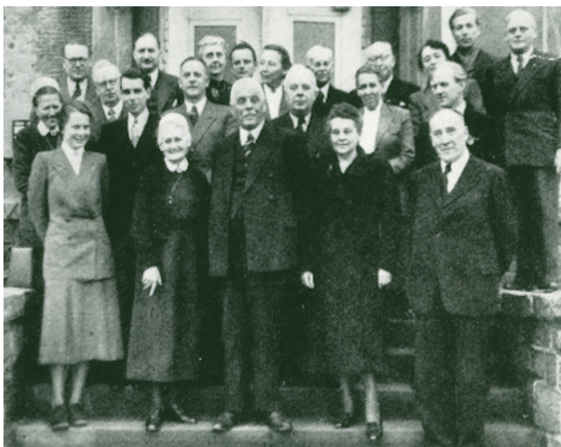
Gründungsversammlung des Deutschen Roten Kreuzes in der Bundesrepublik Deutschland auf dem Rittersturz bei Koblenz

Nach Ende des 2. Weltkrieges ließen die britische und die amerikanische Besatzungsmacht in ihren Besatzungszonen das Rote Kreuz auf Kreisverbandsebene weiterarbeiten und begünstigten die Neubildung von Landesverbänden noch im Jahr 1945. Voraussetzung war allerdings eine strikte Entnazifizierung aller Leitungskräfte. In der französischen Besatzungszone waren Rotkreuzverbände zunächst zugelassen, wurden aber im Januar 1946 plötzlich aufgelöst, um im April 1947 erneut zugelassen zu werden. 1947 und 1948 trafen sich die aus den Landesverbänden gebildeten Rotkreuz-Arbeitsgemeinschaften auf den sogenannten Zonenversammlungen.