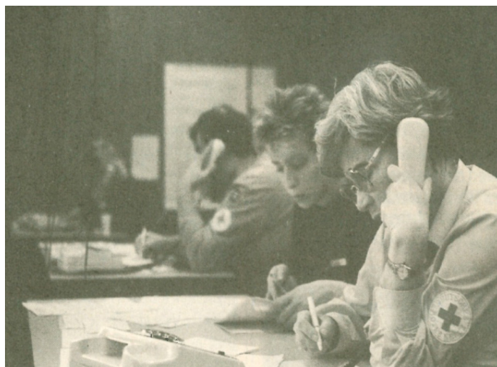
Vermittlungsstelle des DRK Landesverbandes Hamburg e.V.

sive. Hamburgerinnen und Hamburger boten die Übernachtungsmöglichkeiten telefonisch an und die Besucher konn-