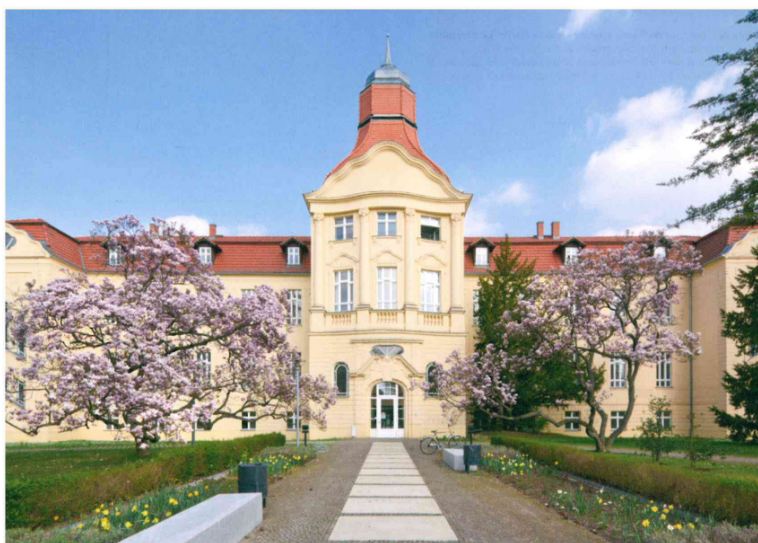
Sitz des Deutschen Roten Kreuzes e.V. in Berlin-Lichterfelde seit 2001

Im Einigungsvertrag zwischen dem Deutschen Roten Kreuz der Deutschen Demokratischen Republik sowie seinen neu gegründeten Landesverbänden und dem Deutschen Roten Kreuz in der Bundesrepublik Deutschland vom 8. November 1990 heißt es in Art. 9: „Das DRK unterhält wie bisher eine Geschäftsstelle (Generalsekretariat) am Sitz der Bundesregierung. Es trifft die notwendigen Vorbereitungen, um die Geschäftsstelle zu verlegen, wenn die Bundesregierung ihren Sitz nach Berlin verlegt.“ Bereits im Einigungsvertrag zwischen der Bundesrepublik Deutschland und der Deutschen Demokratischen Republik war festgelegt worden, dass mit der Vereinigung zum 3. Oktober 1990 Berlin die Hauptstadt des vereinigten Deutschlands sein solle. Am 20. Juni 1991 fasste dann der Deutsche Bundestag seinen sogenannten Hauptstadtbeschluss, nach dem Berlin auch Regierungssitz sein solle. Das war die Grundlage für das DRK, sich nach geeigneten Räumlichkeiten für seinen neuen Sitz in Berlin umzusehen.