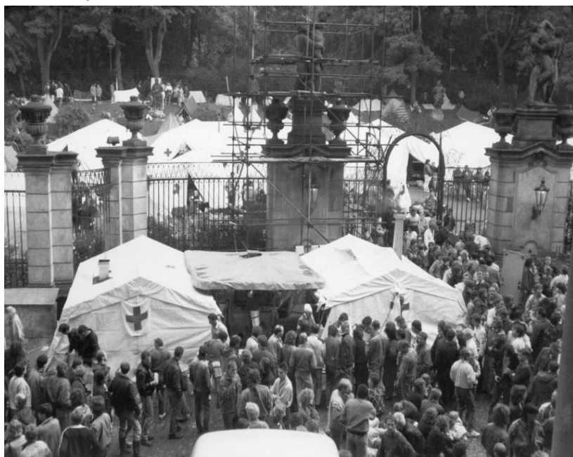
Sommer 1989 DDR-Flüchtlinge im Garten der westdeutschen Botschaft in Prag

Weitere Flüchtlinge versuchen ihr Glück über die Botschaften der Bun-