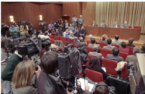
Pressekonferenz am 9. November 1989 in Ost-Berlin

Und so trägt Günter Schabowski vorlaufenden Mikrofonen und Kameras den folgenden Text vor: