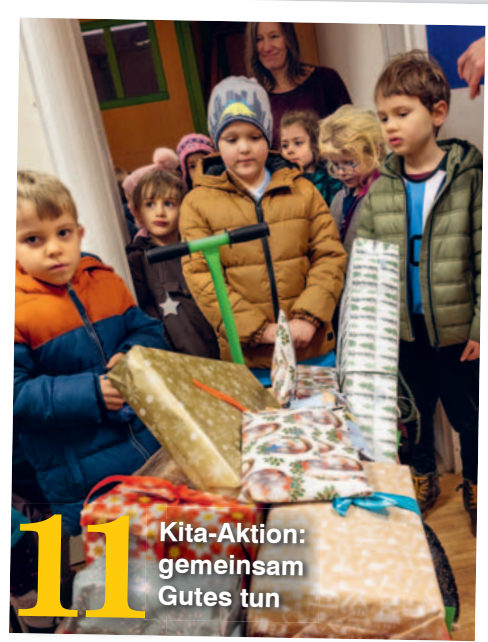
11 Kita-Aktion: gemeinsam Gutes tun