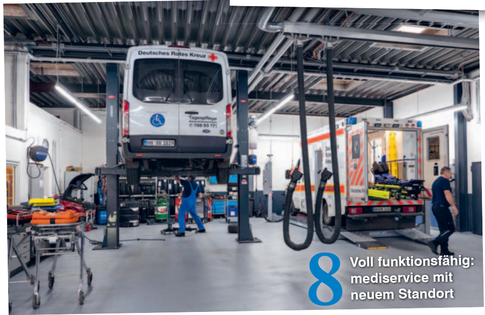
8 Voll funktionsfähig: mediservice mit neuem Standort