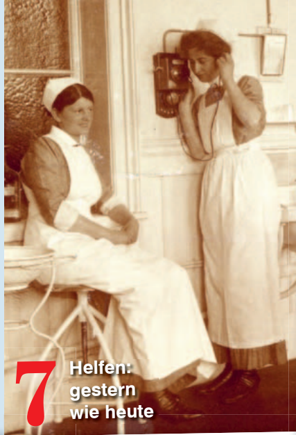
7 Helfen: gestern wie heute