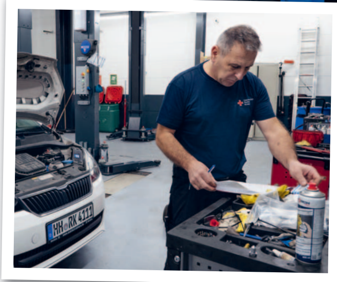
Text: Constanze Bandowski