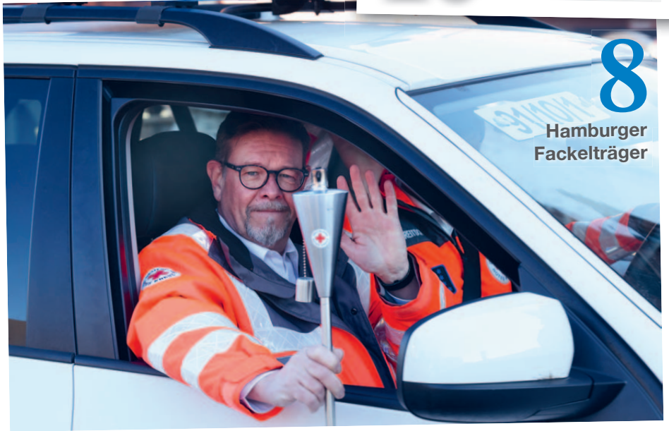
Hält die Fäden in der Hand