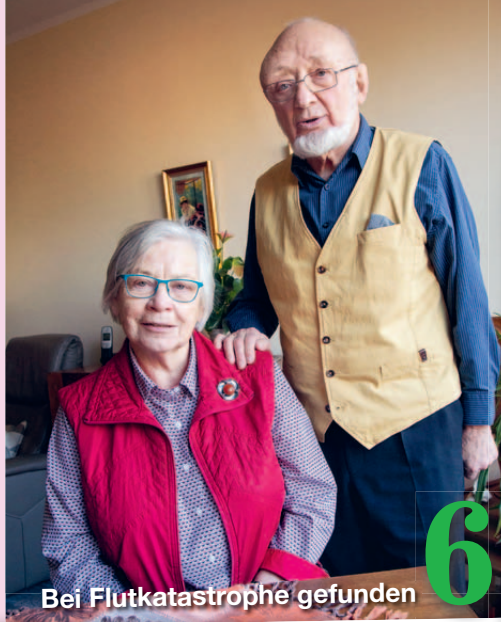
Bei Flutkatastrophe gefunden